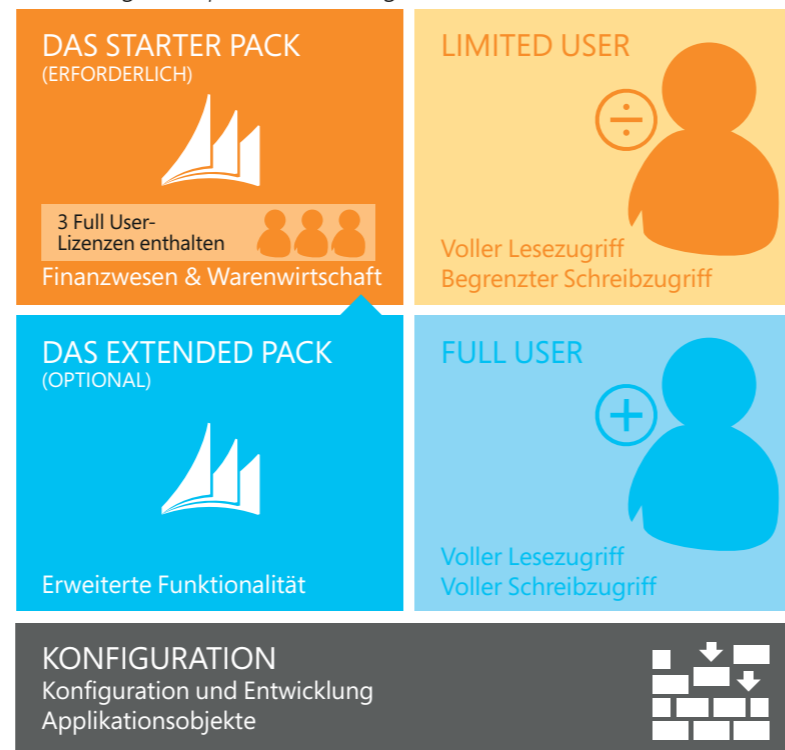
Abbildung 1: Perpetual Licensing im Überblick

Das Lizenzmodell Perpetual Licensing für Microsoft Dynamics NAV 2016 unterstützt mittelständische und kleine Unternehmen beim unmittelbaren, kostengünstigen Einstieg in die Bereiche Finanzwesen und Warenwirtschaft und ermöglicht ihnen, nach und nach weitere Bereiche einzubeziehen. Bei Perpetual Licensing lizenzieren Sie die Funktionalität der ERP-Lösung, und der Zugriff auf diese Funktionalität wird mittels Nutzerlizenzen sichergestellt.