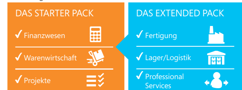
Abbildung 2: Starter Pack und Extended Pack – Funktionalität

Beide Lizenzmodelle wurden für größtmögliche Einfachheit im Kaufprozess konzipiert. Kunden können zwischen zwei Nutzertypen auf Basis von Concurrent Usern, das heißt nicht namensgebundenen Benutzern, wählen: Limited User und Full User. Zudem können sie bei umfassenderen Anforderungen den Zugriff dieser Nutzer auf das Extended Pack lizenzieren.