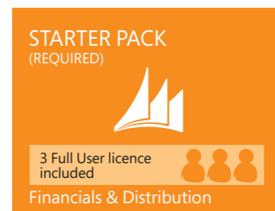
Abbildung 3: Starter Pack

Für viele Unternehmen sind die Funktionalitäten in dieser Lizenzkomponente bereits ausreichend.